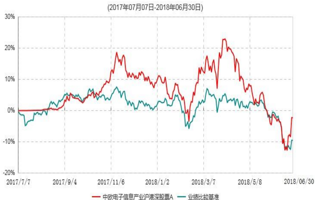
中欧电子信息产业沪港深股票A累计净值增长率与业绩比较基准收益率历史走势对比图

注：本基金基金合同生效日期为2017年7月7日，自基金合同生效日起到本报告期末不满一年，按基金合同的规定，本基金自基金合同生效起六个月为建仓期，建仓期结束时各项资产配置比例已达到基金合同约定。