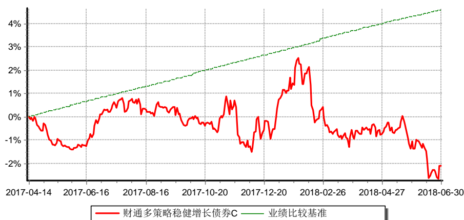
财通多策略稳健增长债券型证券投资基金C 累计净值增长率与业绩比较基准收益率历史走势对比图 (2017年4月14日-2018年6月30日)

(4) 本基金自2017年4月14日起增设收取销售服务费的C类份额，原份额变更为A类份额。