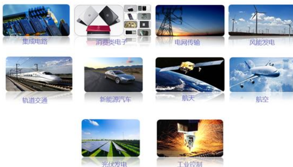
公司产品应用领域

公司主要产品包括半导体材料、半导体器件、新能源材料、新材料的制造及销售；融资租赁业务；高效光伏电站项目开发及运营。产品的应用领域，包括集成电路、消费类电子、电网传输、风能发电、轨道交通、新能源汽车、航空、航天、光伏发电、工业控制等产业。