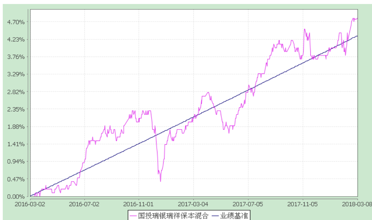
国投瑞银瑞祥保本混合型证券投资基金 份额累计净值增长率与业绩比较基准收益率历史走势对比图 (2018 年 1 月 1 日至 2018 年 3 月 8 日)

注：根据《国投瑞银瑞祥保本混合型证券投资基金基金合同》的有关规定，2018 年 3 月 2 日为国投瑞银瑞祥保本混合型证券投资基金的保本周期到期日。在本基金的到期期间内，即 2018 年 3 月 2 日至 2018 年 3 月 8 日本基金接受赎回、转换转出申请，不接受申购和转换转入申请。自 2018 年 3 月 9 日，国投瑞银瑞祥保本混合型证券投资基金转型为国投瑞银瑞祥灵活配置混合型证券投资基金，因此上表报告期间的结束日为 2018 年 3 月 8 日。