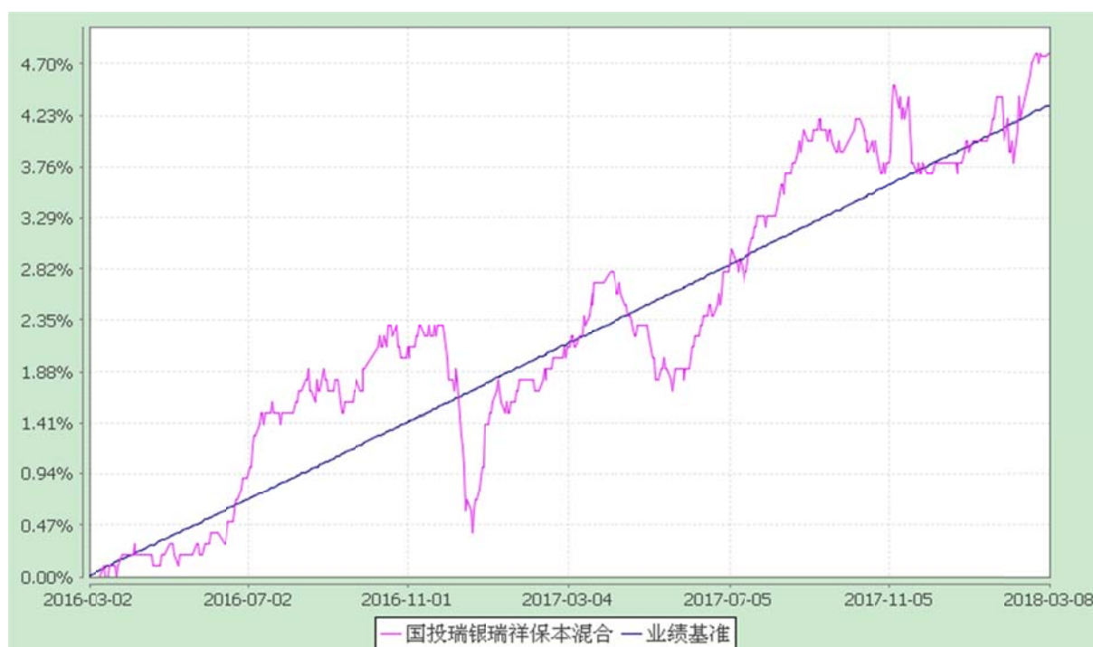
国投瑞银瑞祥保本混合型证券投资基金 份额累计净值增长率与业绩比较基准收益率历史走势对比图 (2018年1月1日至2018年3月8日)

注：根据《国投瑞银瑞祥保本混合型证券投资基金基金合同》的有关规定，2018年3月2日为国投瑞银瑞祥保本混合型证券投资基金的保本周期到期日。在本基金的到期期间内，即2018年3月2日至2018年3月8日本基金接受赎回、转换转出申请，不接受申购和转换转入申请。自2018年3月9日，国投瑞银瑞祥保本混合型证券投资基金转型为国投瑞银瑞祥灵活配置混合型证券投资基金，因此上表报告期间的结束日为2018年3月8日。