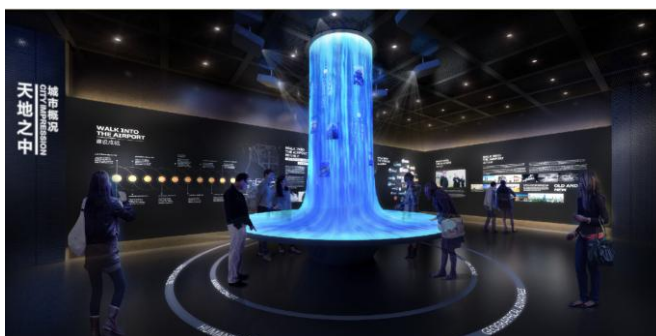
郑州航空港经济综合实验区展示项目

公司CG视觉场景综合服务，是围绕核心创意内容，以CG技术为主要表现手段，通过合理设计规划，结合多种空间构筑形式和多媒体辅助手段，共同构建出具备高度艺术化、个性化、体验感和互动感的特定展示场景；具体可以结合成像技术，互动触摸、体感技术、虚拟/增强/混合现实等互动内容，搭配各类多媒体内容及表演、舞台机械等多种演绎形式并辅以场景构建。主要产品形式为各类展厅、展馆、展览、发布会、主题活动等。该类业务的主要客户和典型需求主要如各类产业园区展、城市规划展、房地产企业展、产品发布会、企业文化宣传展、主题活动以及博物馆、展览馆的数字化布展等。CG视觉场景综合服务相关产品和服务图示如下：