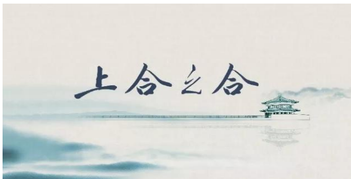
新华社“上合之合”3D水墨宣传片