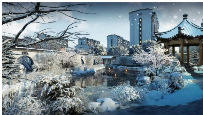
某楼盘建筑效果图

公司CG静态视觉服务是利用CG技术，通过计算机软件模拟，将设计人员的创意和构思展现为数码化的静态图像。该服务主要产品形式为各类视觉效果图像，主要客户为建筑设计、规划设计、工业设计等行业。作为产业链中专业化分工的一个重要环节，公司通过专业技术和专注服务，帮助各行业呈现理想的虚拟效果。CG静态视觉服务相关产品与服务图示如下：