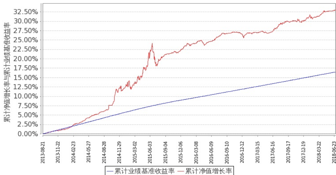
图 1：嘉实丰益信用定期债券 A 基金份额累计净值增长率与同期业绩比较基准收益率的历史走势对比图