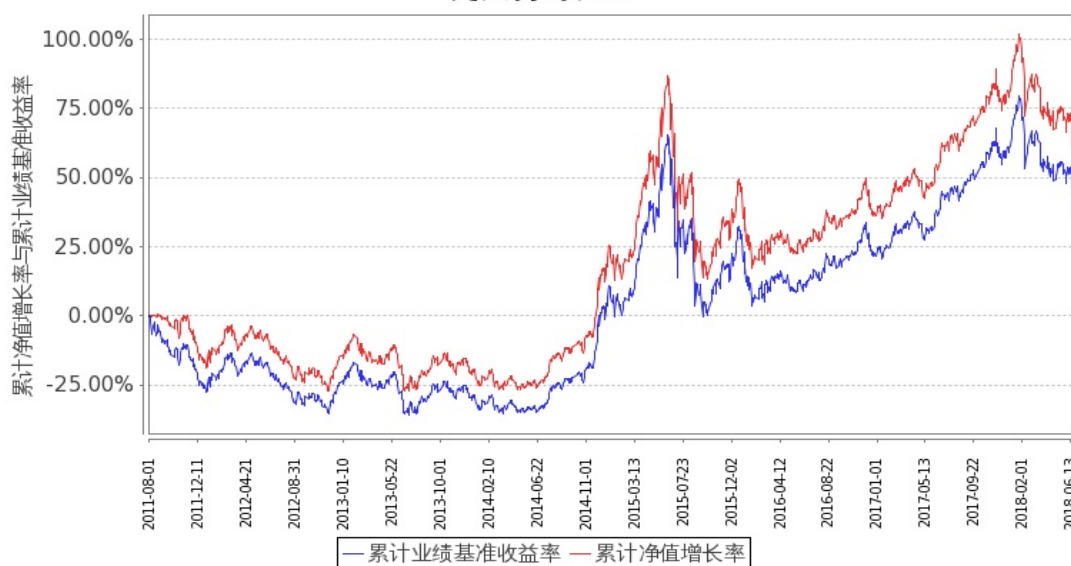
图 1：嘉实深证基本面 120ETF 联接 A 基金份额累计净值增长率与同期业绩比较基准收益率的历史走势对比图