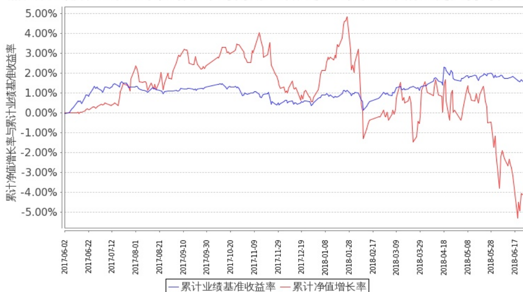
嘉实稳宏债券A累计净值增长率与同期业绩比较基准收益率的历史走势对比图