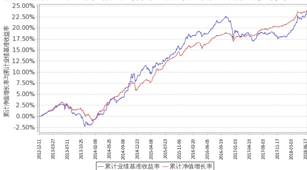
图 1：嘉实纯债债券 A 基金份额累计净值增长率与同期业绩比较基准收益率的历史走势对比图 (2012 年 12 月 11 日至 2018 年 6 月 30 日)