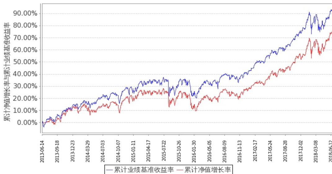
图 2：嘉实美国成长股票型证券投资基金-美元现汇基金份额累计净值增长率与同期业绩比较基准收益率的历史走势对比图