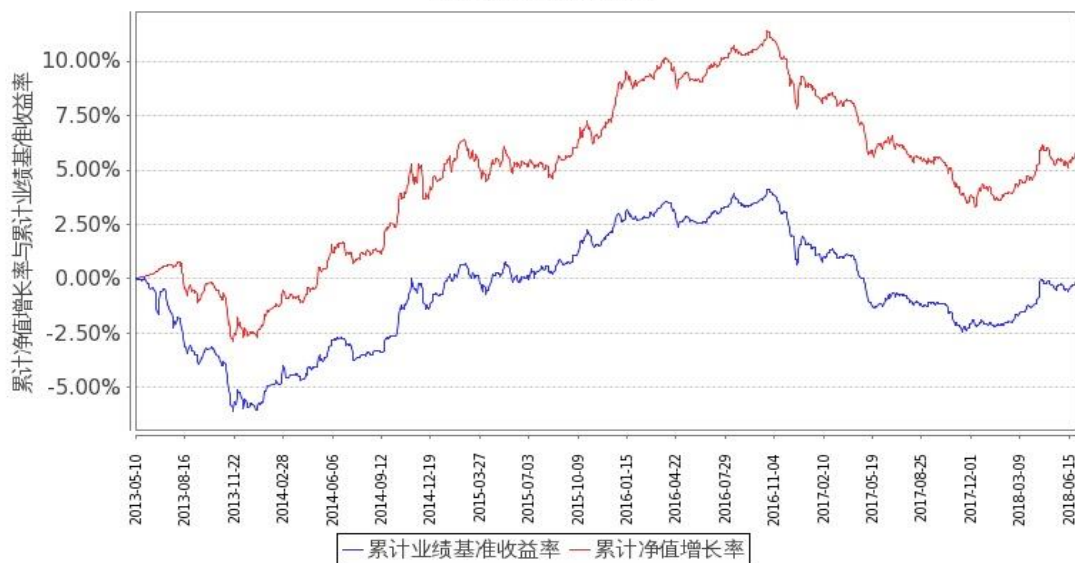
图 2：嘉实中证金边中期国债 ETF 联接 C 基金份额累计净值增长率与同期业绩比较基准收益率的历史走势对比图