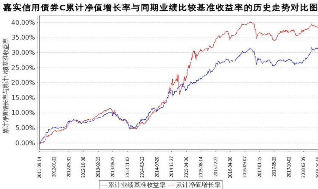
图 2: 嘉实信用债券 C 基金份额累计净值增长率与同期业绩比较基准收益率的历史走势对比图