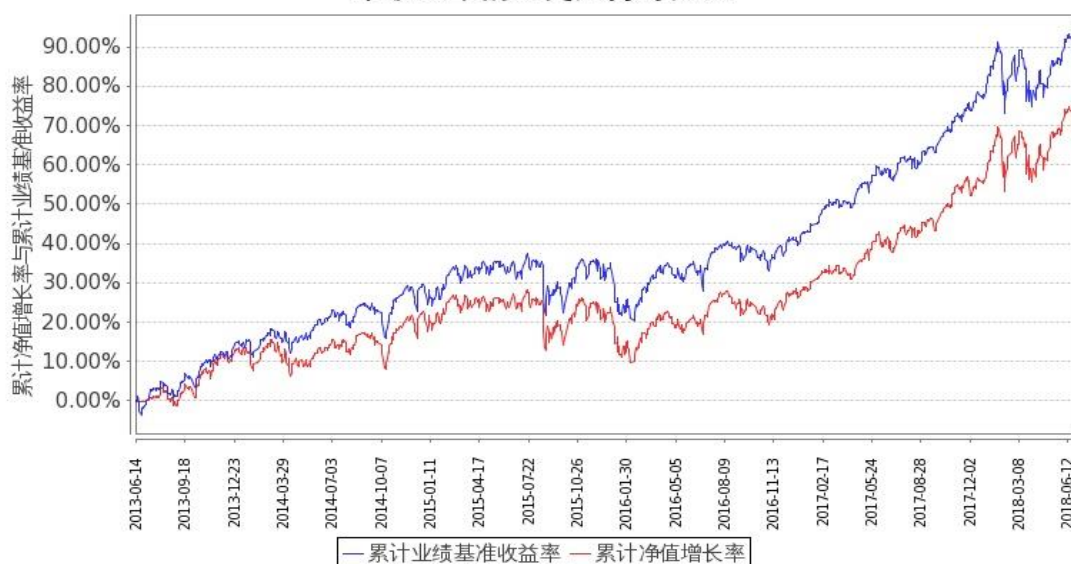
图 2：嘉实美国成长股票型证券投资基金-美元现汇基金份额累计净值增长率与同期业绩比较基准收益率的历史走势对比图