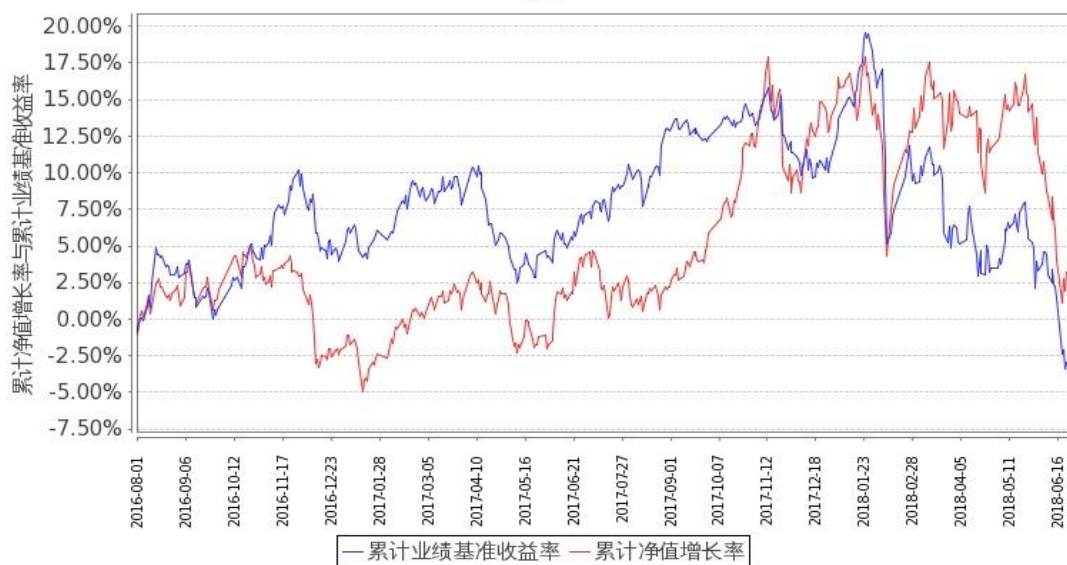
图 2：嘉实成长收益混合 H 基金份额累计净值增长率与同期业绩比较基准收益率的历史走势对比图