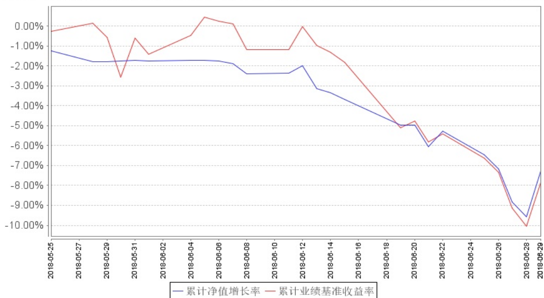
鹏华沪深300指数增强累计净值增长率与同期业绩比较基准收益率的历史走势对比图