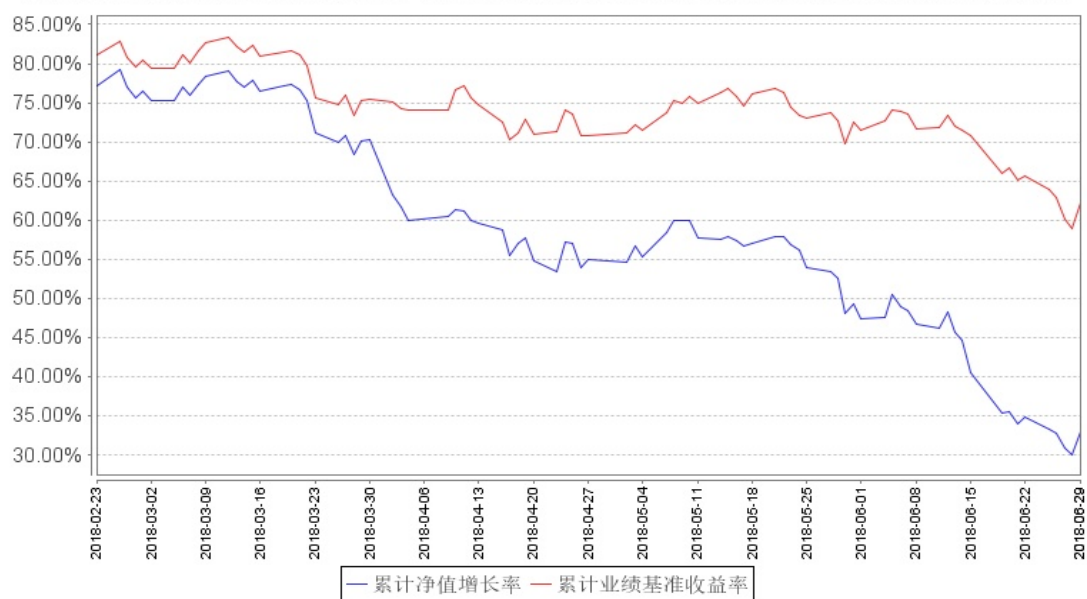
鹏华量化先锋混合累计净值增长率与同期业绩比较基准收益率的历史走势对比图