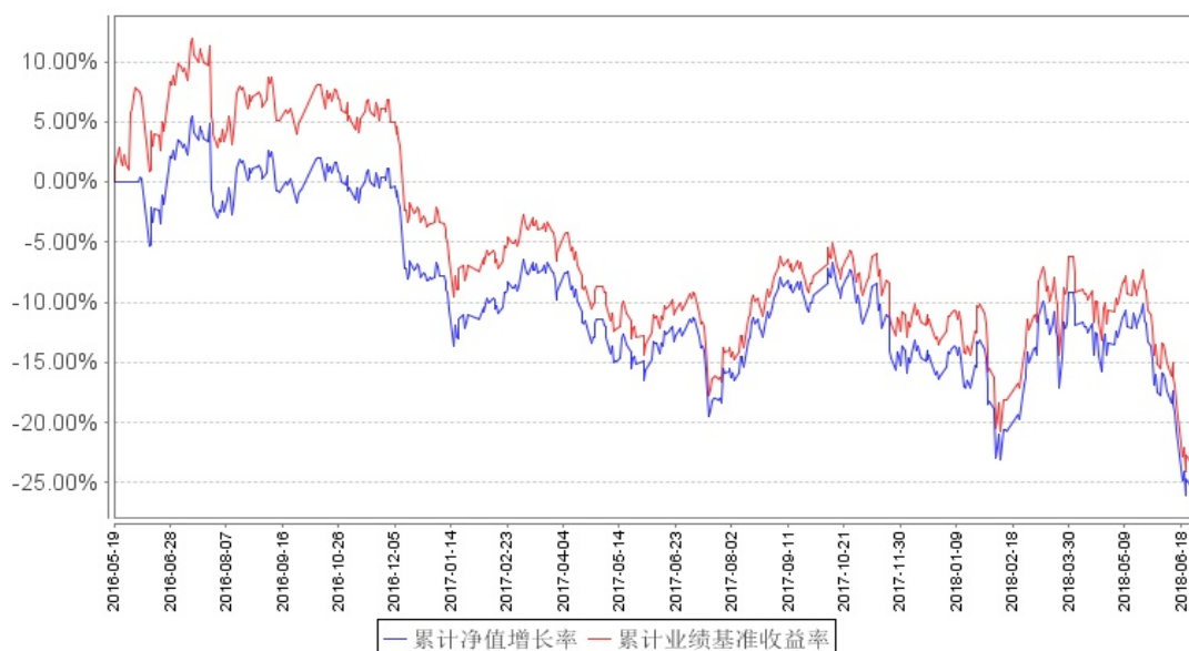
南方创业板ETF联接累计净值增长率与同期业绩比较基准收益率的历史走势对比图