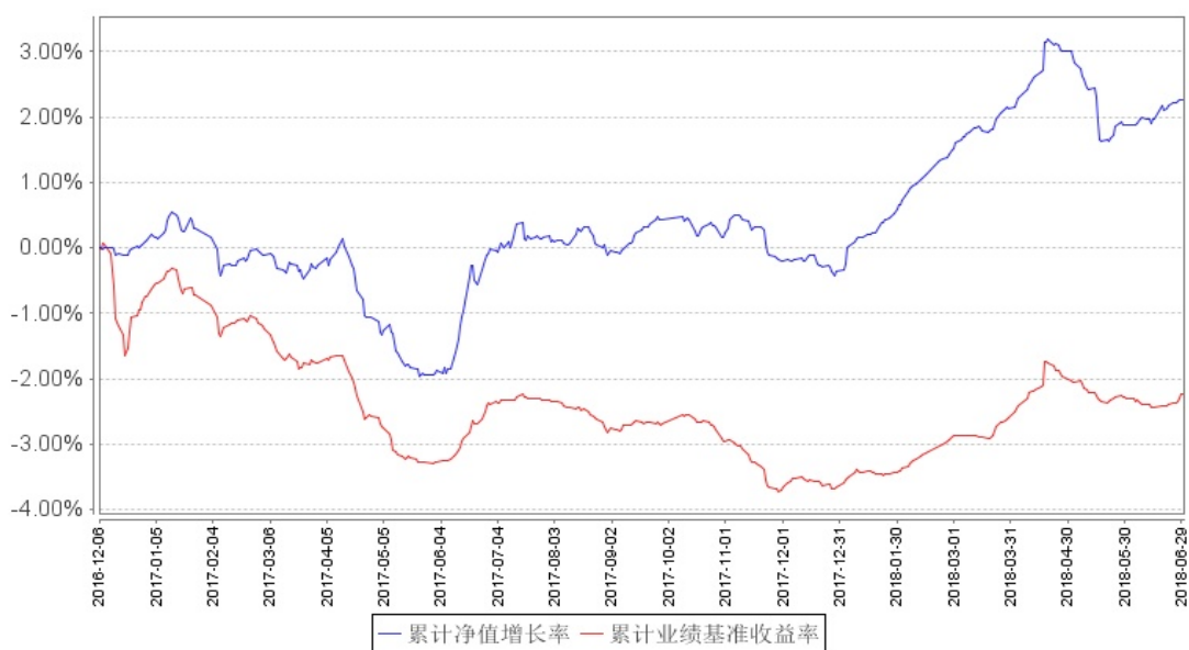
南方宣利A累计净值增长率与同期业绩比较基准收益率的历史走势对比图