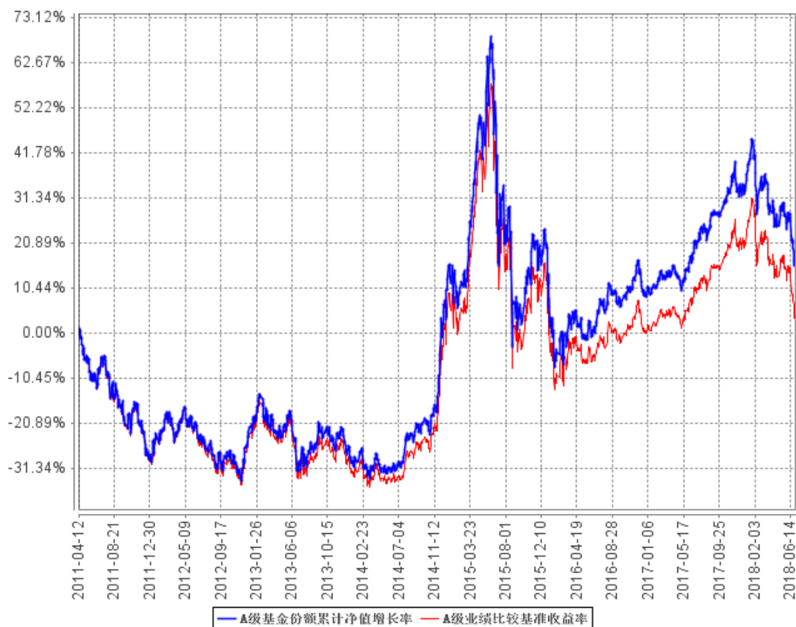
A级基金份额累计净值增长率与同期业绩比较基准收益率的历史走势对比图