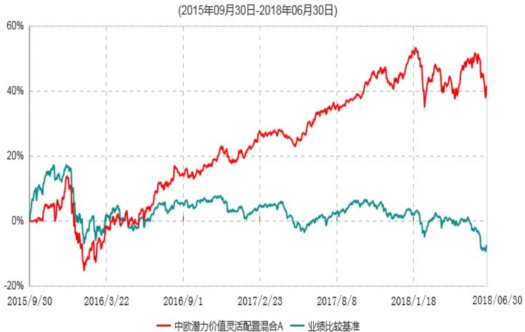
中欧潜力价值灵活配置混合A累计净值增长率与业绩比较基准收益率历史走势对比图