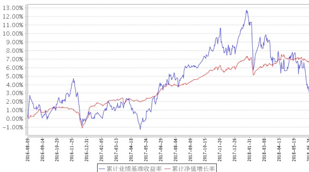
安信新目标混合A累计净值增长率与同期业绩比较基准收益率的历史走势对比图