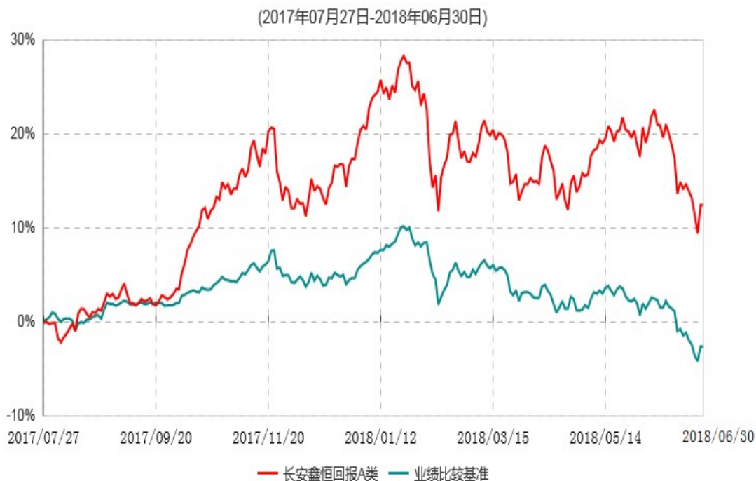
长安鑫恒回报A类累计净值增长率与业绩比较基准收益率历史走势对比图

根据基金合同的规定，自基金合同生效日起 6 个月内基金各项资产配置比例需符合基金合同要求。本基金在建仓期结束后，各项资产配置比例已符合基金合同有关投资比例的约定。基金合同生效日至报告期末，本基金运作时间未满一年。图示日期为 2017 年 7 月 27 日至 2018 年 6 月 30 日。