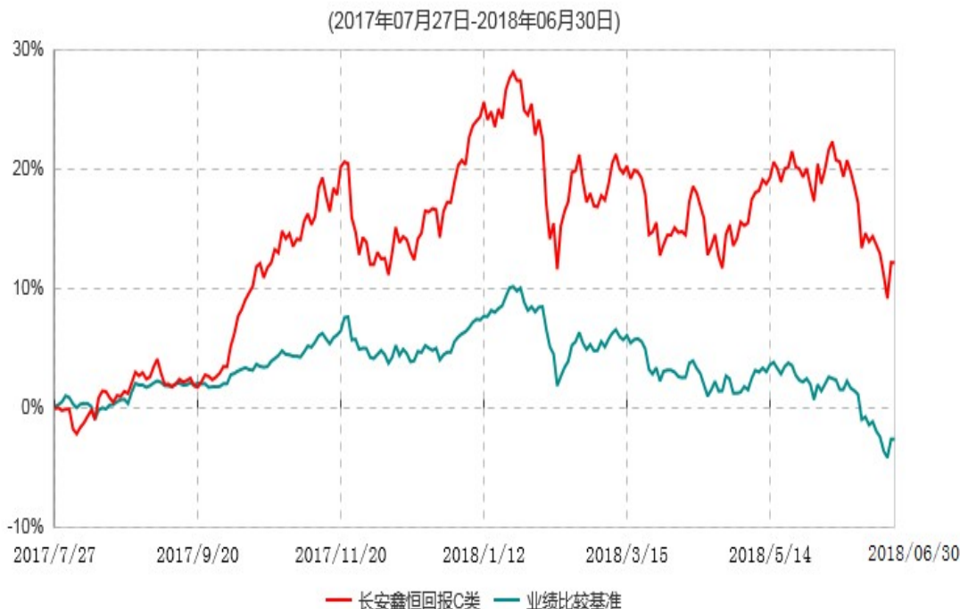
长安鑫恒回报C类累计净值增长率与业绩比较基准收益率历史走势对比图

根据基金合同的规定，自基金合同生效日起 6 个月内基金各项资产配置比例需符合基金合同要求。本基金在建仓期结束后，各项资产配置比例已符合基金合同有关投资比例的约定。基金合同生效日至报告期末，本基金运作时间未满一年。图示日期为 2017 年 7 月 27 日至 2018 年 6 月 30 日。