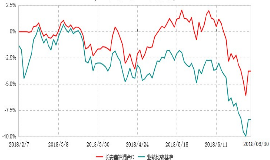
长安鑫禧混合C累计净值增长率与业绩比较基准收益率历史走势对比图 (2018年02月07日-2018年06月30日)

本基金于 2018 年 02 月 07 日成立。根据基金合同的规定，自基金合同生效日起 6 个月内基金各项资产配置比例需符合基金合同要求。本基金仍在建仓期，图示日期为 2018 年 02 月 07 日至 2018 年 6 月 30 日。