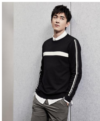
海澜之家品牌产品