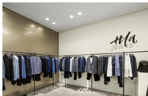
HLA JEANS 品牌门店