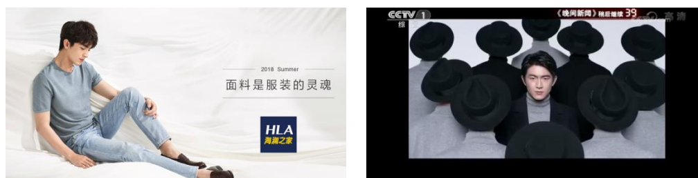
产品及品牌宣传图片