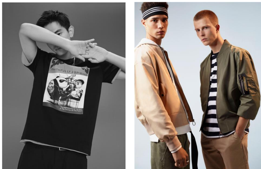
HLA JEANS 品牌产品