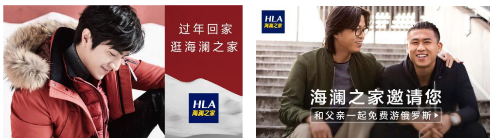
春节及父亲节品牌营销