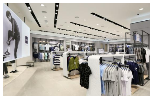
海澜之家品牌门店