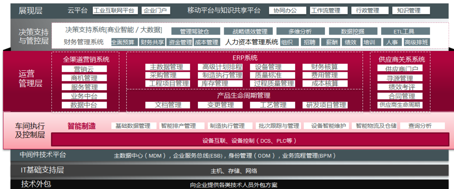
赛意信息360°信息化服务全景图

在十多年的快速发展过程中，公司积累了丰富的解决方案及众多的行业客户案例，成功为超过500家来自于制造、零售、服务等行业的企业级客户提供了丰富而具有竞争力的数字化转型服务，拥有华为技术、美的集团、大疆创新、视源股份、奥克斯集团等众多优质客户。公司的咨询顾问团队在企业数字化转型过程中的规划咨询、方案设计、系统实施、应用集成及设备互联等领域具有丰富的实施经验，技术研究团队