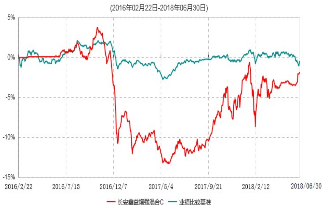
长安鑫益增强混合C累计净值增长率与业绩比较基准收益率历史走势对比图

本基金基金合同生效日为 2016 年 02 月 22 日，基金合同生效日至报告期期末，本基金