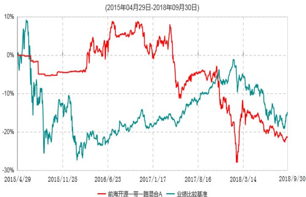
前海开源一带一路混合A累计净值增长率与业绩比较基准收益率历史走势对比图