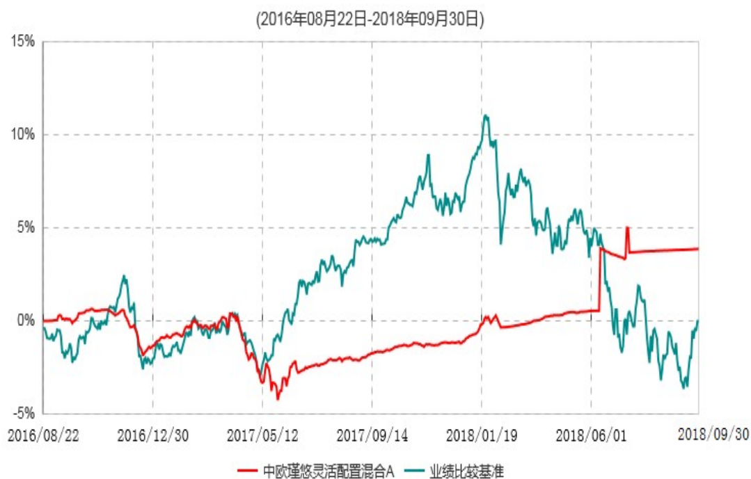
中欧瑾悠灵活配置混合A累计净值增长率与业绩比较基准收益率历史走势对比图