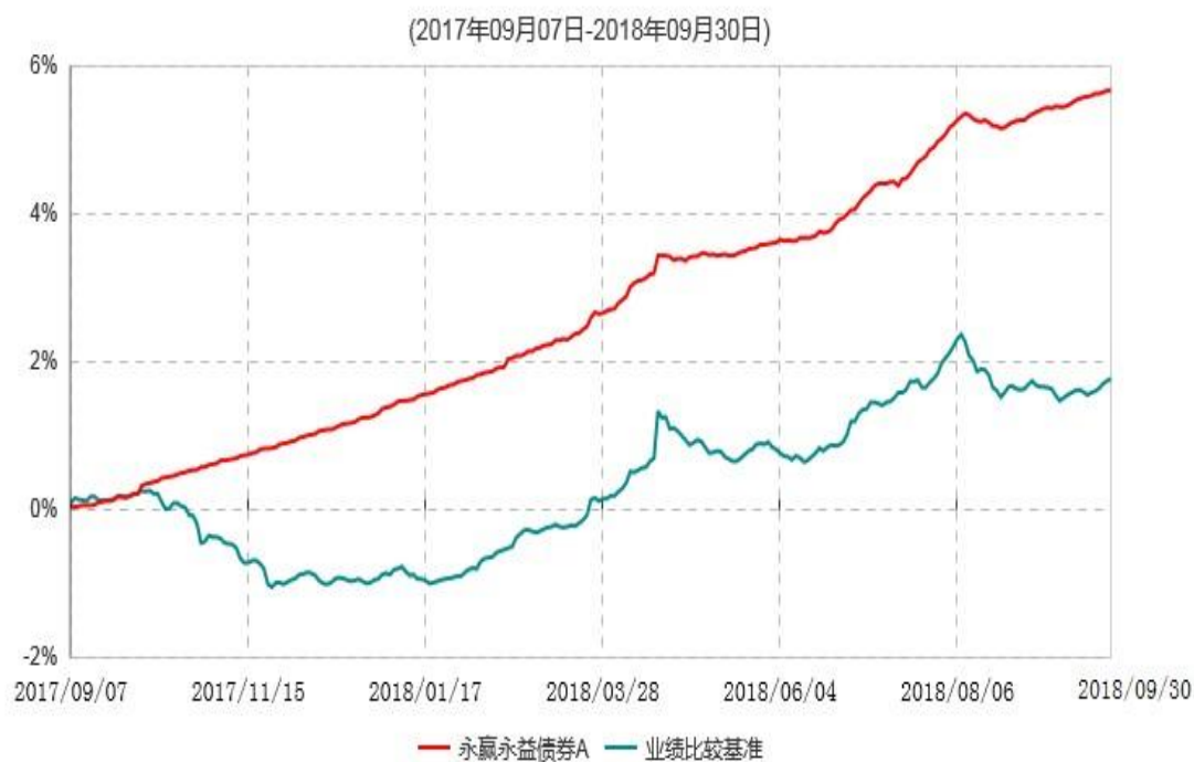
永赢永益债券A累计净值增长率与业绩比较基准收益率历史走势对比图