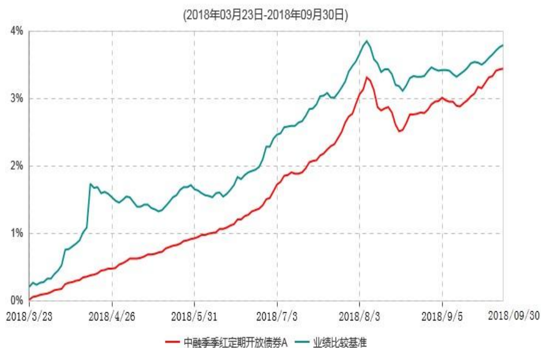
中融季季红定期开放债券A累计净值增长率与业绩比较基准收益率历史走势对比图