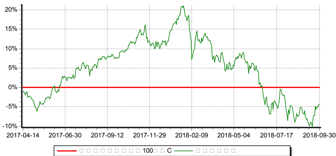
中证财通中国可持续发展100(ECPI ESG)指数增强型证券投资基金C 累计净值增长率与业绩比较基准收益率历史走势对比图 (2017年04月14日-2018年9月30日)

注：(1)本基金合同生效日为2013年3月22日；自2017年4月14日起本基金增设收取销售服务费的C类份额，报告期内未有C类份额申购数据，报告期内单位净值为1.0000元。