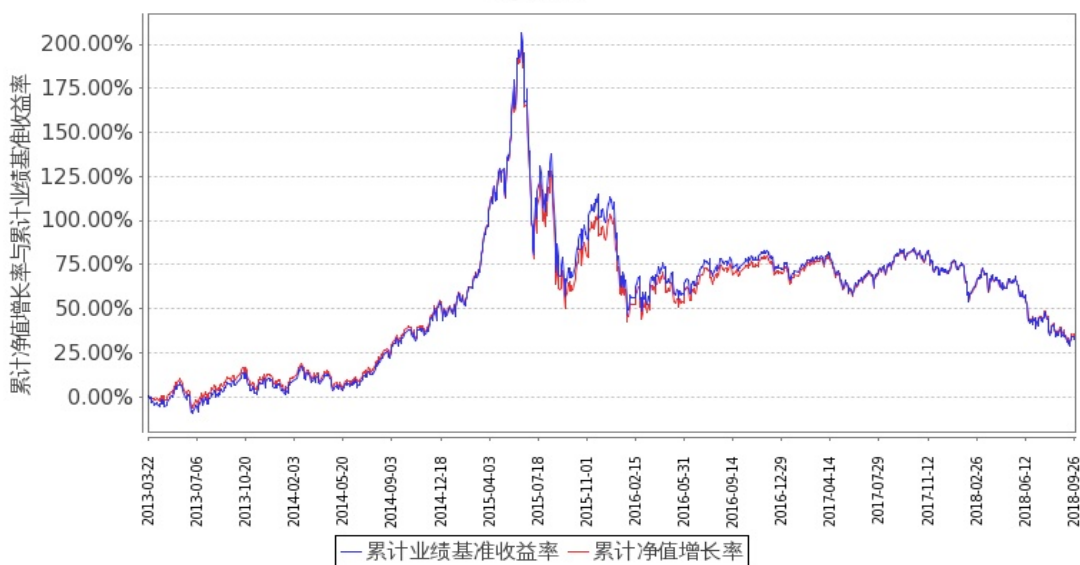
图 1：嘉实中证 500ETF 联接 A 份额累计净值增长率与同期业绩比较基准收益率的历史走势对比图