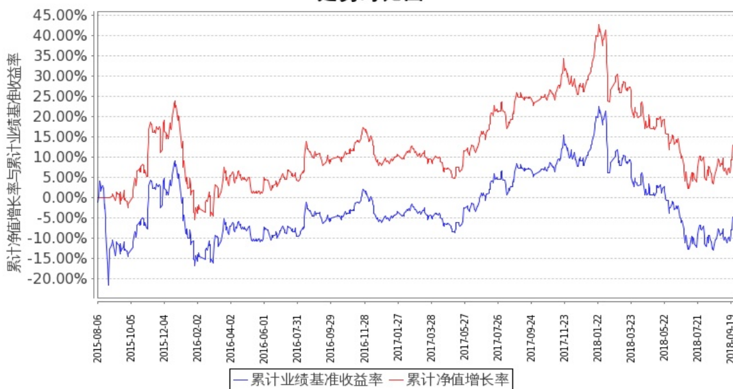
图：嘉实中证金融地产ETF联接A基金份额累计净值增长率与同期业绩比较基准收益率的历史走势对比图 (2015年8月6日至2018年9月30日)