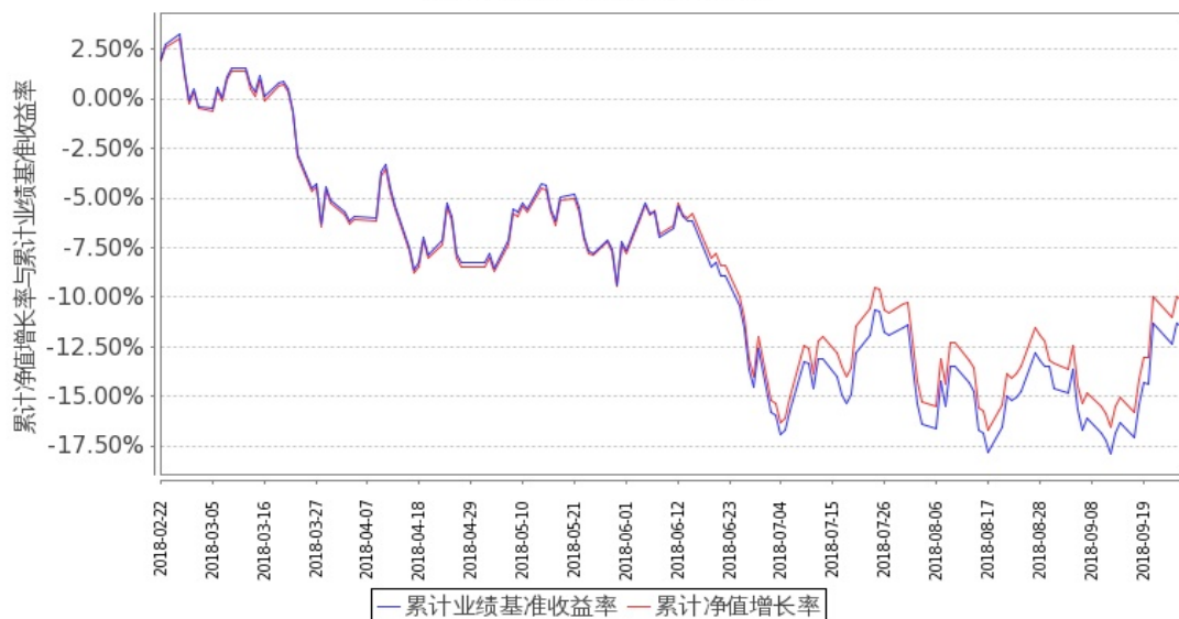
图 2：嘉实富时中国 A50ETF 联接基金 C 类基金份额累计净值增长率与同期业绩比较基准收益率的历史走势对比图 (2018 年 2 月 22 日至 2018 年 9 月 30 日)

注：按基金合同和招募说明书的约定，本基金自基金合同生效日起 6 个月内为建仓期，建仓期结束时本基金的各项投资比例符合基金合同（十二（二）投资范围和（四）投资限制）的有关约定。