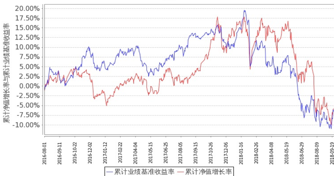
图 2：嘉实成长收益混合 H 基金份额累计净值增长率与同期业绩比较基准收益率的历史走势对比图