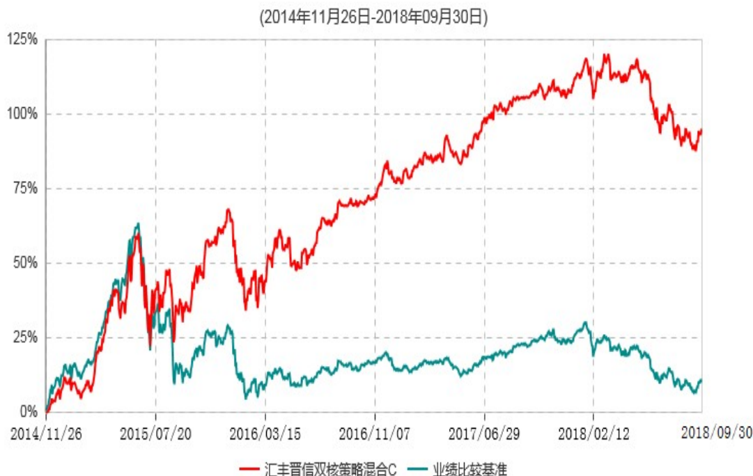
汇丰晋信双核策略混合C累计净值增长率与业绩比较基准收益率历史走势对比图