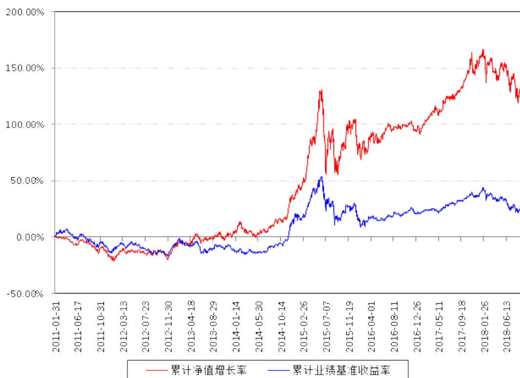
南方优选成长A累计净值增长率与同期业绩比较基准收益率的历史走势对比图