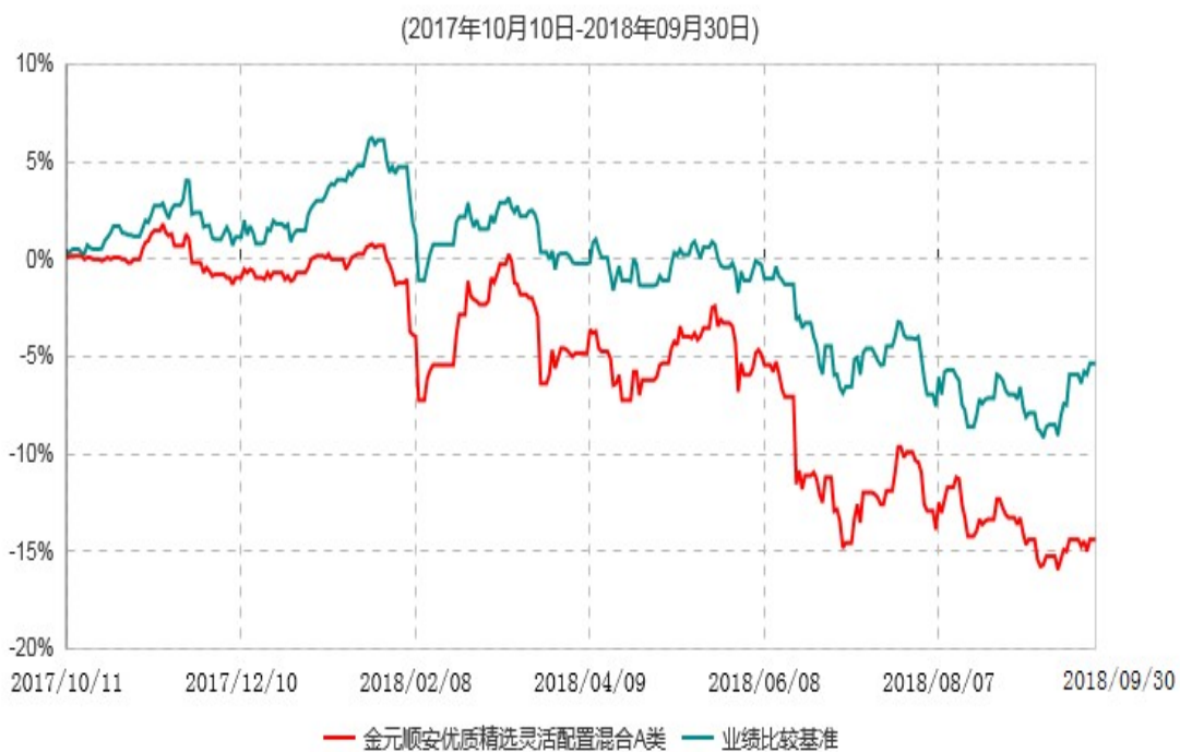
金元顺安优质精选灵活配置混合C类累计净值增长率与业绩比较基准收益率历史走势对比图