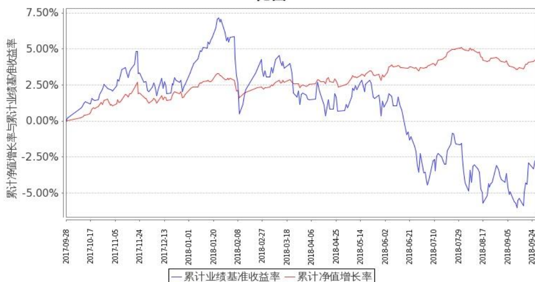
嘉实新添辉定期混合C累计净值增长率与同期业绩比较基准收益率的历史走势对比图