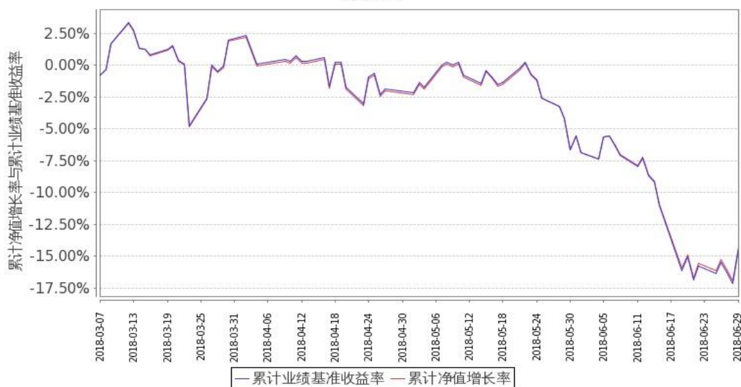
图 2: 嘉实中创 400ETF 联接 C 基金份额累计净值增长率与同期业绩比较基准收益率的历史走势对比图