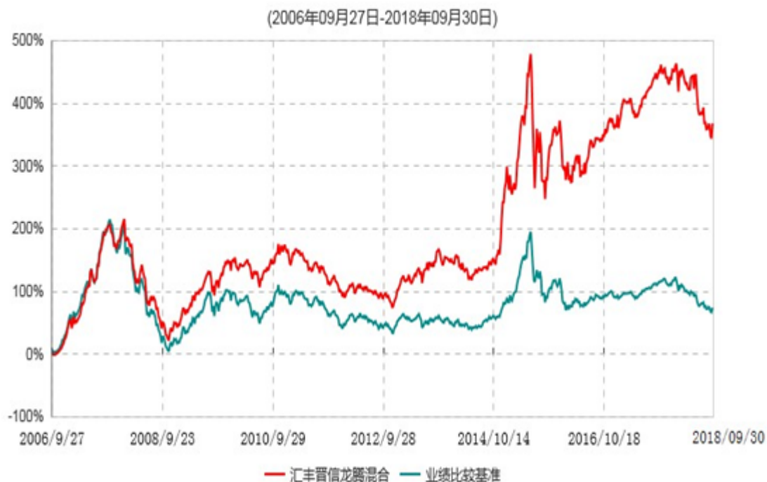
汇丰晋信龙腾混合型证券投资基金累计净值增长率与业绩比较基准收益率历史走势对比图