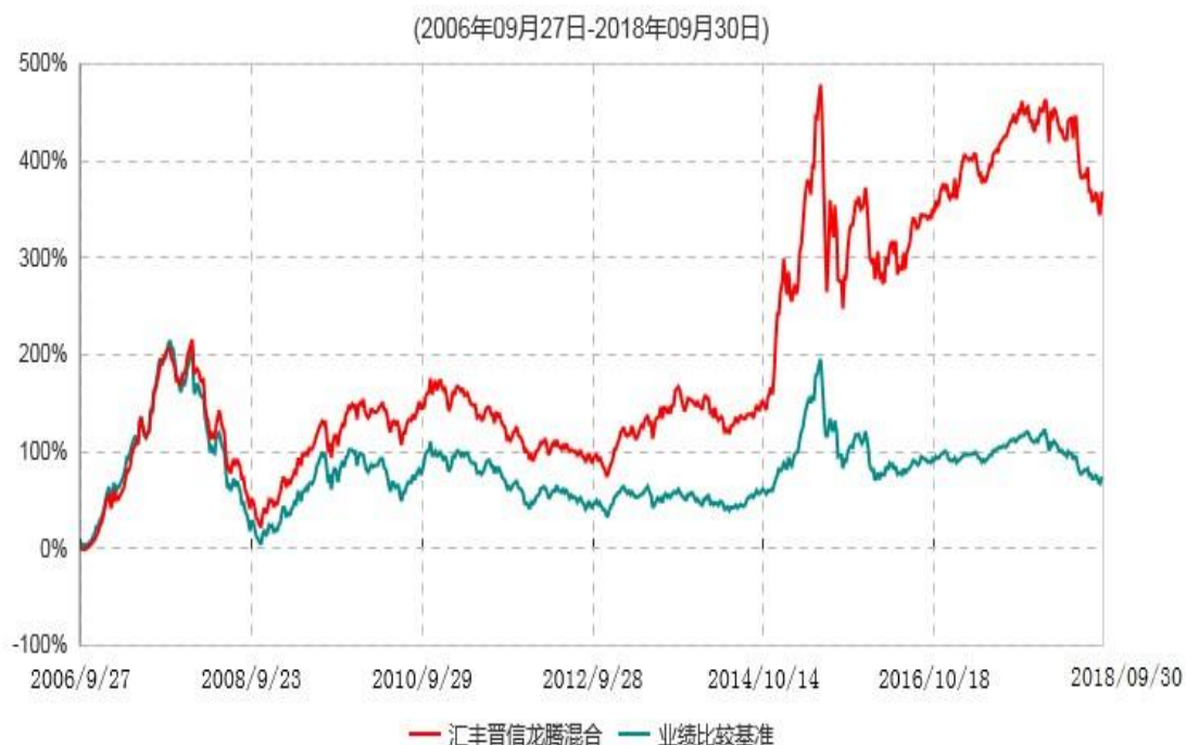
汇丰晋信龙腾混合型证券投资基金累计净值增长率与业绩比较基准收益率历史走势对比图

注：1.按照基金合同的约定，本基金的投资组合比例为：股票占基金资产的60%-95%；除股票以外的其他资产占基金资产的5%-40%，其中现金或到期日在一年期以内的国债的比例合计不低于基金资产净值的5%。本基金自基金合同生效日起不超过6个月内完成建仓。截止2007年3月27日，本基金的各项投资比例已达到基金合同约定的比例。