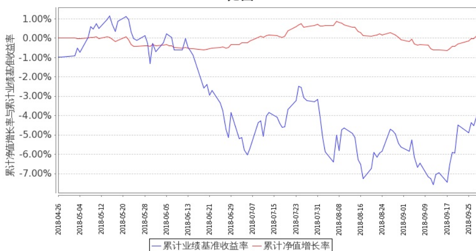
图 2：嘉实新添荣定期混合 C 基金份额累计净值增长率与同期业绩比较基准收益率的历史走势对比图 (2018 年 4 月 26 日至 2018 年 9 月 30 日)

注：本基金基金合同生效日 2018 年 4 月 26 日至报告期末未满 1 年。按基金合同和招募说明书的约定，本基金自基金合同生效日起 6 个月内为建仓期，本报告期处于建仓期内。