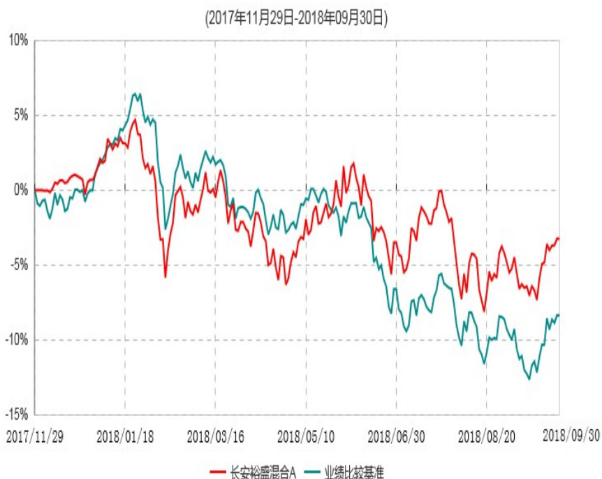
长安裕盛混合A累计净值增长率与业绩比较基准收益率历史走势对比图

根据基金合同的规定,自基金合同生效之日起6个月内基金各项资产配置比例需符合基金合同要求。本基金在建仓期结束后,各项资产配置比例已符合基金合同有关投资比例的约定。基金合同生效日至报告期期末,本基金运作时间未满一年。图示日期为2017年11月29日至2018年09月30日。