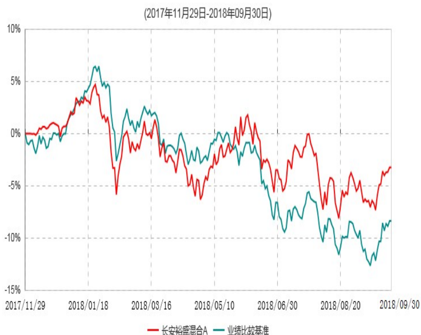
长安裕盛混合A累计净值增长率与业绩比较基准收益率历史走势对比图

根据基金合同的规定,自基金合同生效之日起6个月内基金各项资产配置比例需符合基金合同要求。本基金在建仓期结束后,各项资产配置比例已符合基金合同有关投资比例的约定。基金合同生效日至报告期期末,本基金运作时间未满一年。图示日期为2017年11月29日至2018年09月30日。