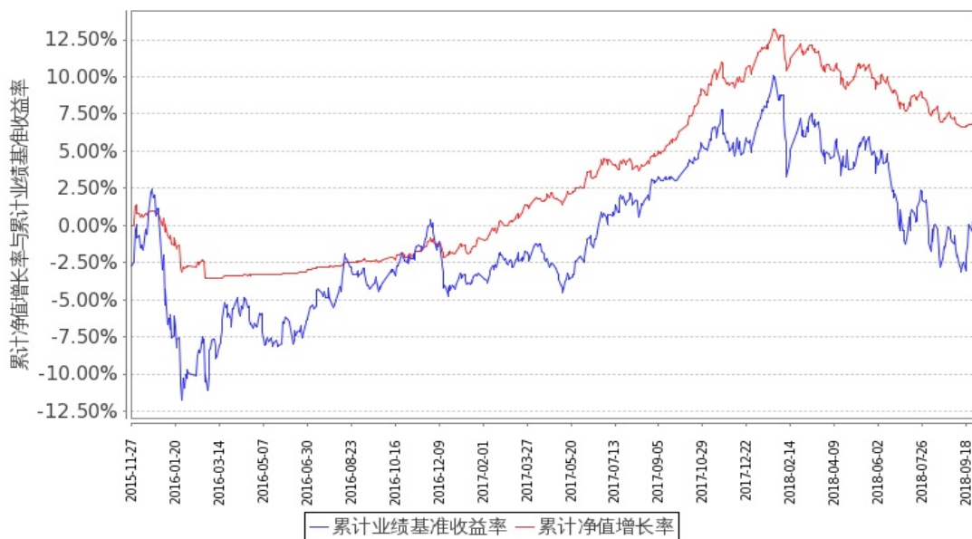
图 1：嘉实新起点混合 A 基金份额累计净值增长率与同期业绩比较基准收益率的历史走势对比图