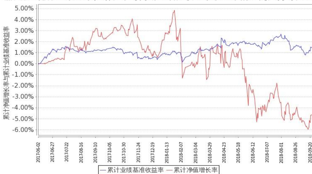
图1：嘉实稳宏债券A基金份额累计净值增长率与同期业绩比较基准收益率的历史走势对比图 (2017年6月2日至2018年9月30日)