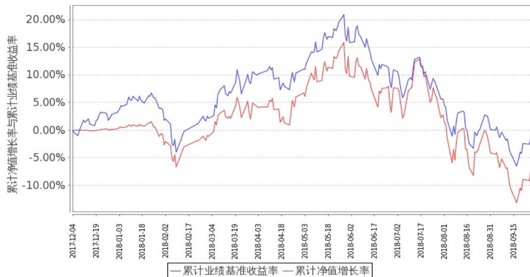
图 1：嘉实医药健康股票 A 基金累计份额净值增长率与同期业绩比较基准收益率的历史走势对比图